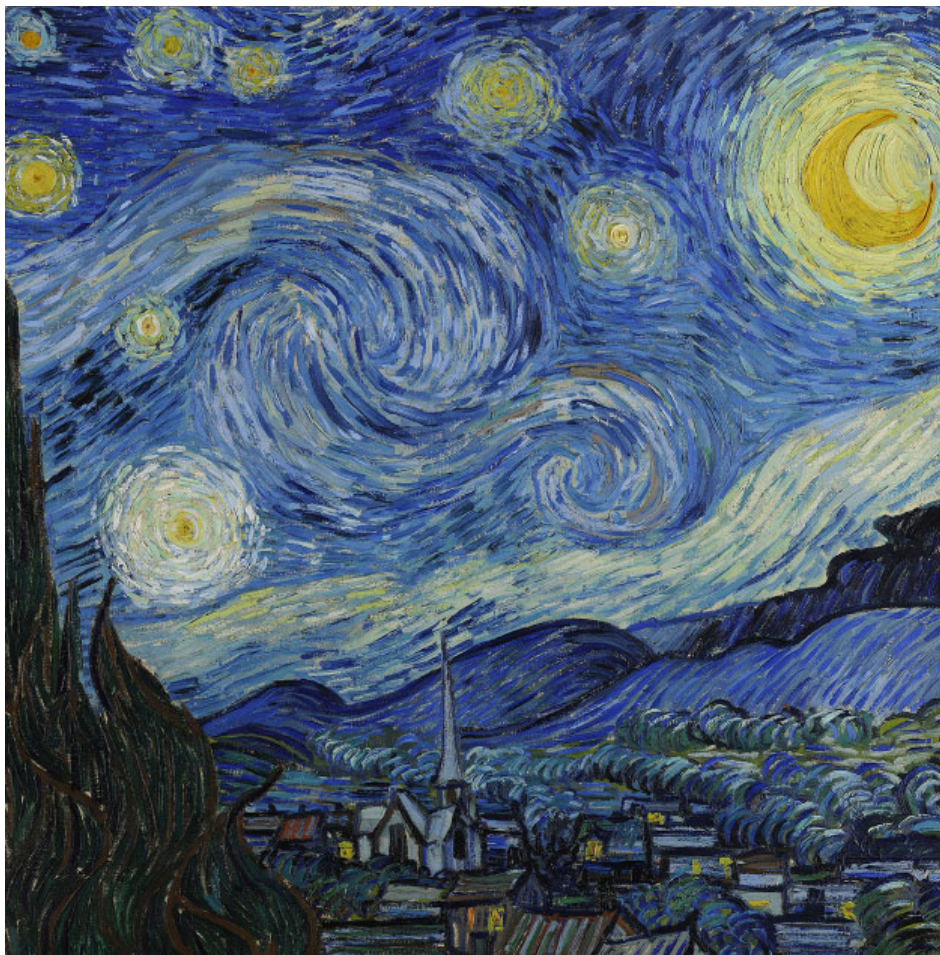
Van Gogh: Csillagos éj (1889), Museum of Modern Art, New York