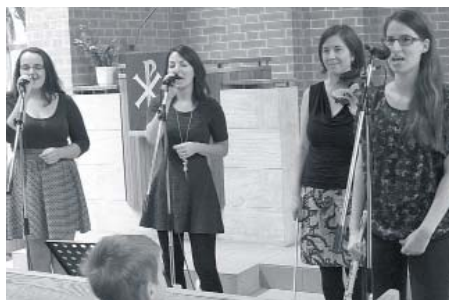
A LIFT! zenekar immár visszatérő kedves vendég evangélikus napjainkon, szívet melengető muzsikával örvendeztettek meg, és kísérték az istentisztelet záró részét