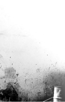
Banksy: Protester Throwing Flowers (Betlehem)

Jöjj el, jöjj el... ahogy már eljöttél, Megöletté, ki sosem öltél. Mégse haltál: feltámadtál, A vég ellen gyógyírt adtál. A csalónak kívül tágasabb; Bennünk süített föl már a Nap.