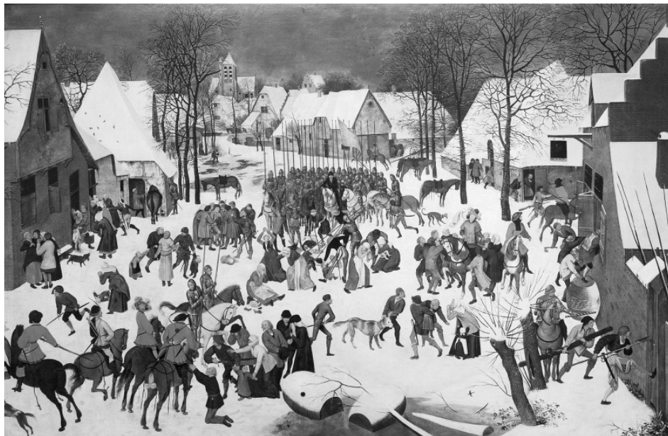
Pieter Bruegel (1525-1569): Kindermoord in Bethlehem – 1566 Kunstareal München - Alte Pinakothek, München, Németország

INDIÁBAN (Kalkutta) a Nemzetközi Lepramisszió kórházat működtet, ahol nagyon sok, lepra hátterű szembeteget is gyógyít egy igen felkészült doktornő és csapata. 2016 óta a magyar támogatásból 300 műtétet végeztek, melyek után a betegek gyógyultan távoztak!