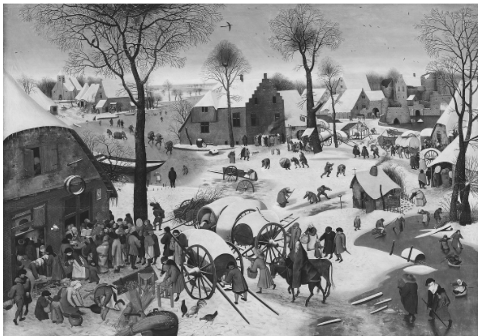
ifjabb Pieter Bruegel (1564-1638): The Census at Bethlehem - 1605-1610 Bonnefantenmuseum, Maastricht, Hollandia