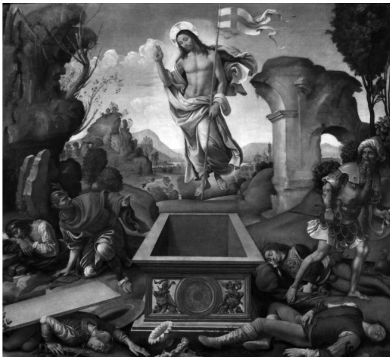
Raffaellino del Carbo: Feltámadás (Resurrection of Christ - ca. 1500-1505 AD) Firenze, Galleria dell'Accademia