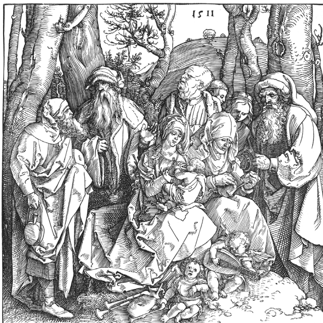
A Szent Család két zenélő angyallal Albrecht Dürer (Nürnberg, 1471. május 21. – Nürnberg, 1528. április 6.) National Gallery of Art, Washington