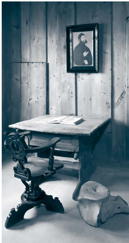
Luther íróasztala a wartburgi várban