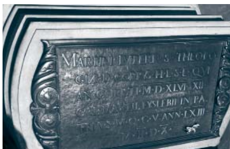
Luther sírja a wittenbergi vártemplomban