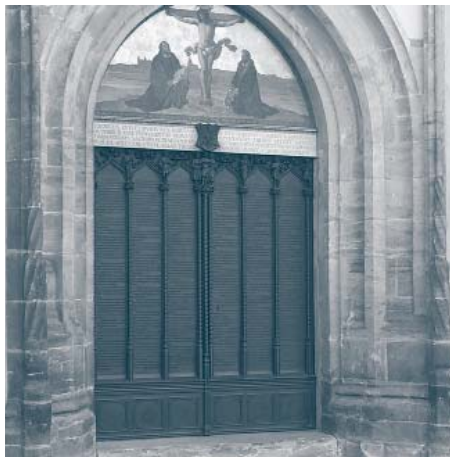
A wittenbergi vártemplom kapuja a 95 tétellel bronzba vésve

Két első ausztriai állomásunk nem tartozott szoros értelemben a reformációi tematikánkhoz, mégis nagy élményt jelen-