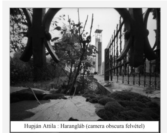
Hupján Attila : Harangláb (camera obscura felvétel)