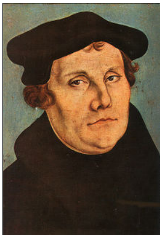
Id. Lukas Cranach: Dr. Martin Luther