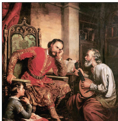
Orlai Petrich Soma: Nádasdy Tamás és Tinódi (olajfestmény, 1855)

Dávidot Isten hagyá királyságban, Ő ellenségét veté gyalázatban. Dícsérjük Istent víg hálaadásban, Énekmondásban.